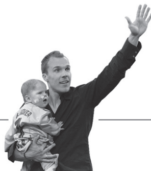
ROBERT ENKE STIFTUNG

„Eine Stiftung mit seinem Namen muss den Anspruch haben, gegen beide Tragödien seines Lebens zu kämpfen, für die Unterstützung herzkranker Kinder genauso wie gegen Depressionen, diese tückische Krankheit, die Robert Enke sogar den Gedanken raubte, wie sehr er das Leben liebte.“